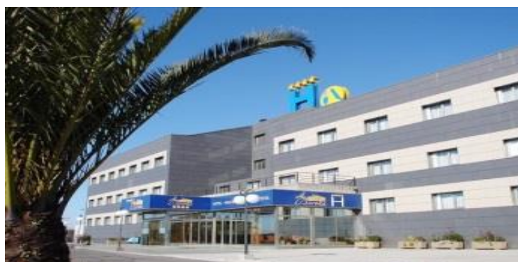
Hotel La Boroña ****