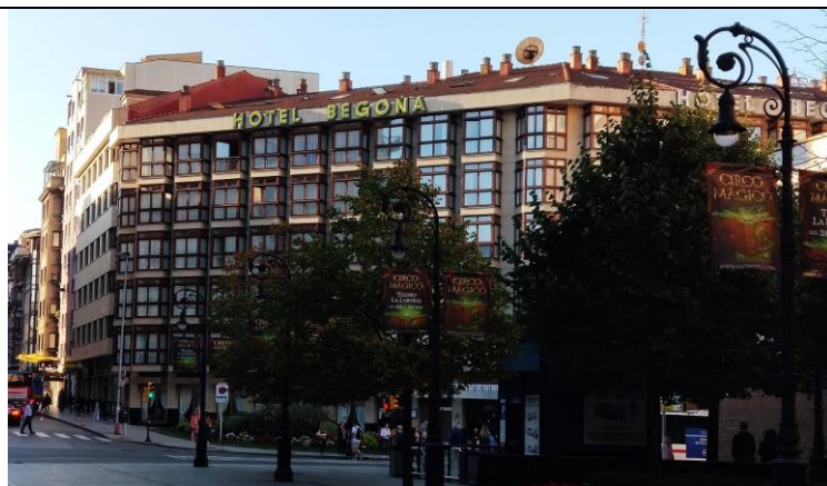
Hotel Begoña ***